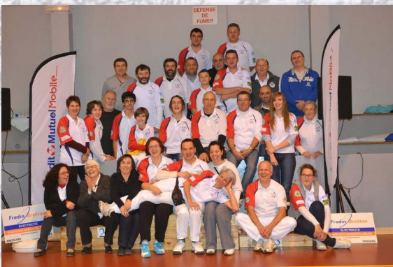
Imprimé par nos soins - Ne pas jeter sur la voie publique

La compétition est un des axes de développement du club depuis sa création, ce qui lui permet d'afficher un palmarès conséquent.